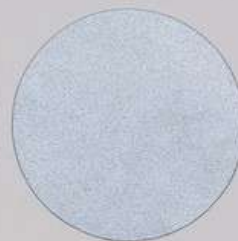
ACS 41 (20 мл)