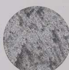
ACS 118 (40 мл)