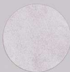
ACS 145 (80 мл)