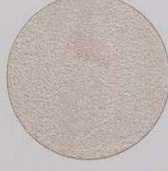
ACS 165 (40 мл)