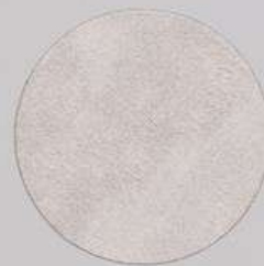
ACS 164 (40 мл)