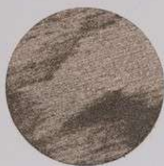
ACS 52 (20 мл)