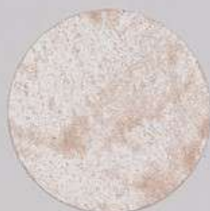
ACS 132 (80 мл)