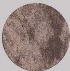
ACS 69 (20 мл)