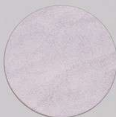
ACS 154 (40 мл)