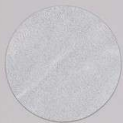
ACS 45 (20 мл)