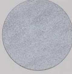
ACS 65 (20 мл)