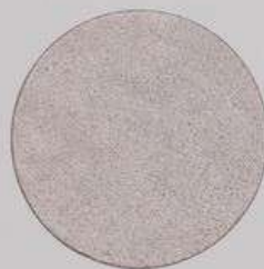
ACS 69 (20 мл)