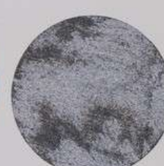
ACS 65 (20 мл)