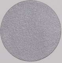
ACS 47 (40 мл)