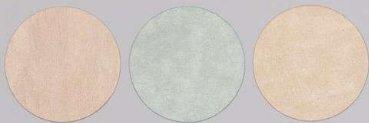
ACS 169 (40 мл)