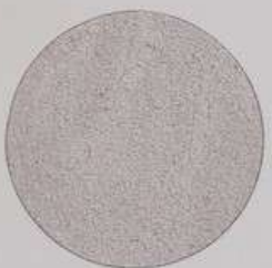
ACS 70 (20 мл)