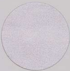
ACS 155 (40 мл)