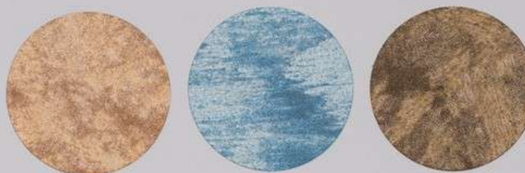
ACS 157 (40 мл)