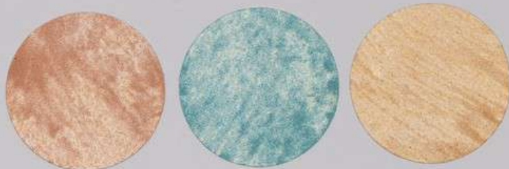
ACS 169 (40 мл)