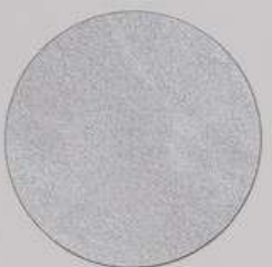
ACS 64 (10 мл)