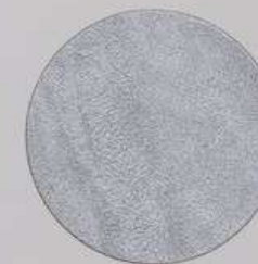
ACS 118 (40 мл)