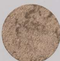
ACS 165 (40 мл)