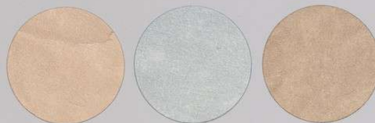
ACS 157 (40 мл)