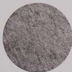
ACS 76 (20 мл)