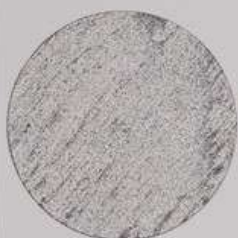
ACS 64 (10 мл)