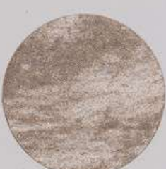
ACS 164 (40 мл)