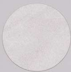
ACS 131 (80 мл)