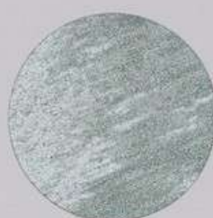
ACS 40 (10 мл)