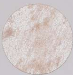
ACS 131 (80 мл)