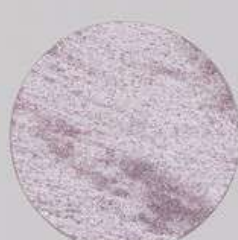
ACS 155 (40 мл)