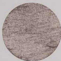
ACS 70 (20 мл)