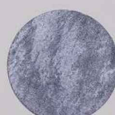
ACS 156 (80 мл)