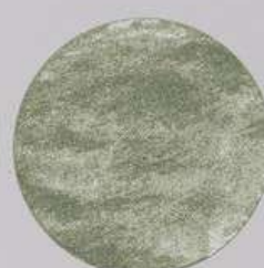
ACS 63 (5 мл)