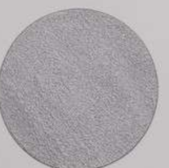
ACS 76 (20 мл)