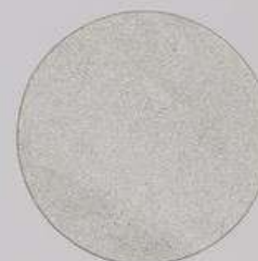
ACS 71 (20 мл)