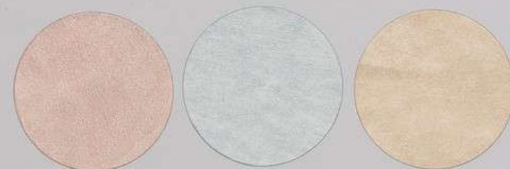
ACS 154 (40 мл)