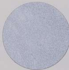
ACS 156 (80 мл)