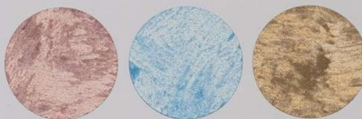
ACS 154 (40 мл)