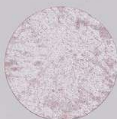
ACS 145 (80 мл)