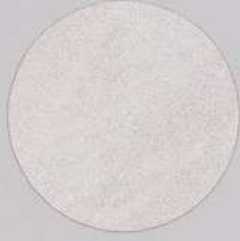
ACS 132 (80 мл)