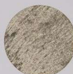
ACS 71 (20 мл)