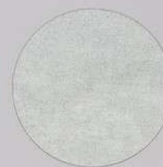
ACS 63 (5 мл)