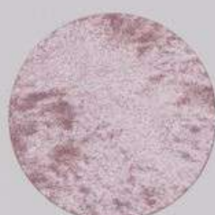
ACS 154 (40 мл)