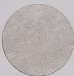
ACS 52 (20 мл)