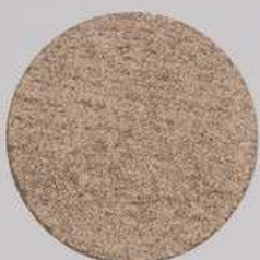
ACS 51 (40 мл)