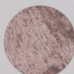
ACS 68 (10 мл)