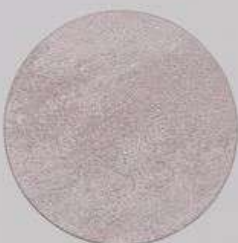
ACS 68 (10 мл)