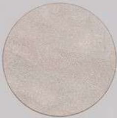
ACS 51 (40 мл)