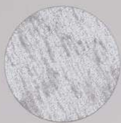
ACS 45 (20 мл)