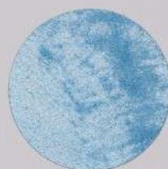
ACS 151 (40 мл)