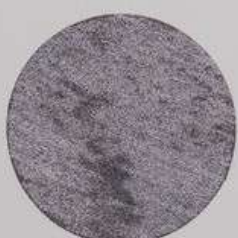
ACS 47 (40 мл)