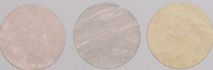
ACS 155 (40 мл)