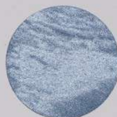
ACS 41 (20 мл)