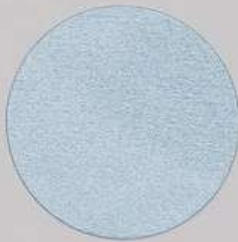
ACS 151 (40 мл)