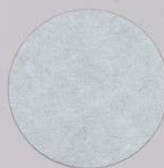
ACS 40 (10 мл)