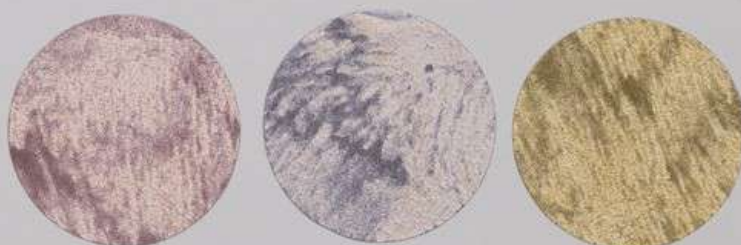
ACS 155 (40 мл)